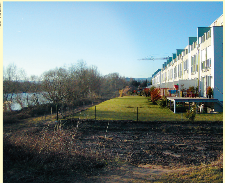
Hochwasserangepasste Bauweise mit erhöhtem Erdgeschoss